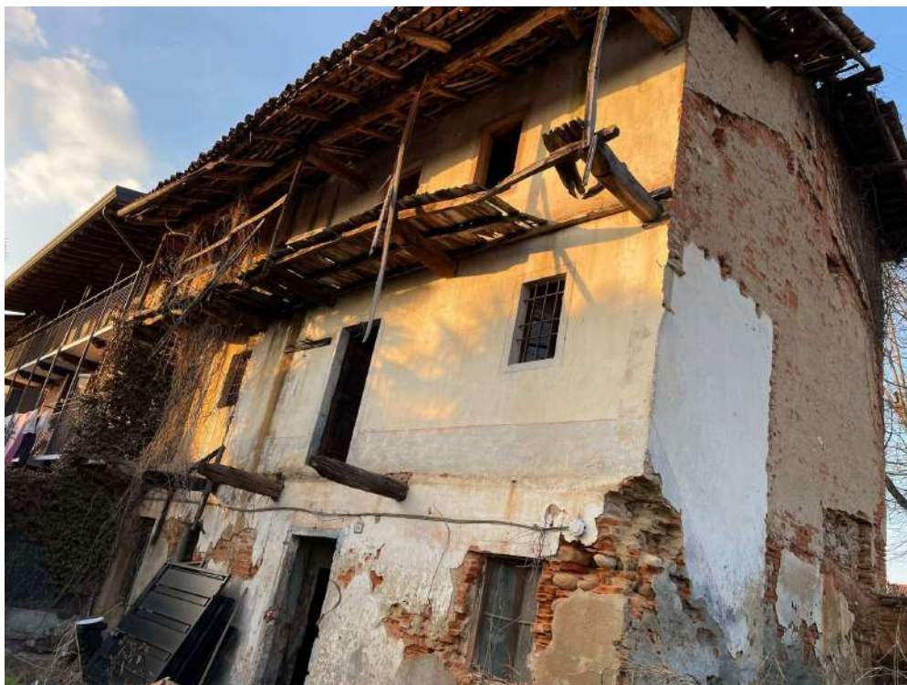
VISTA NORD EST 4