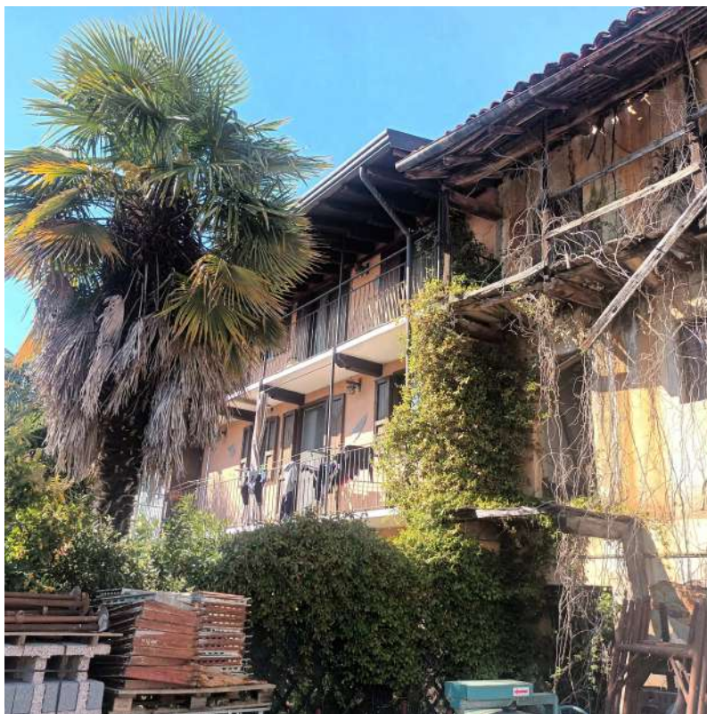
VISTA SUD 2